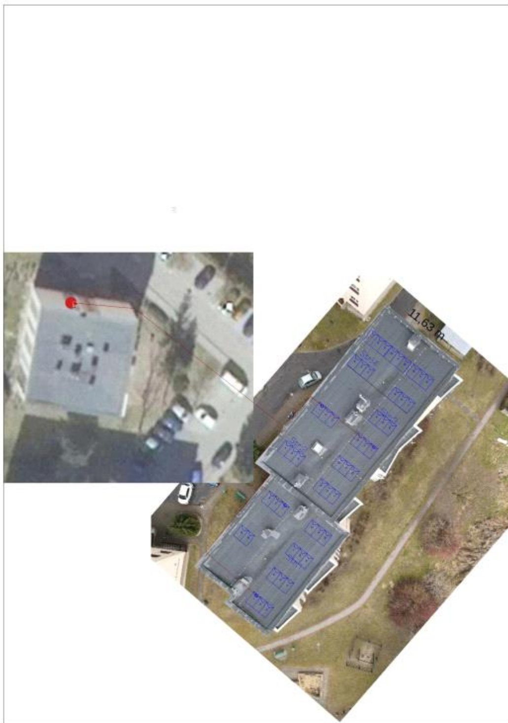
Figura 2: Umieszczenie generatora fotowoltaicznego i grupy konwersji